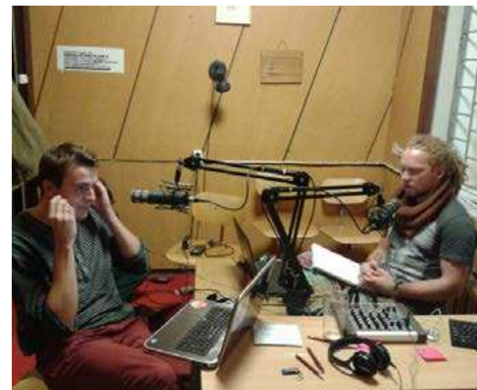
Gene Õhtust! saatejuhis Generaadio otse-eetris novembris 2014

mõtted selgeks saada. Mõistsime, et peame raadio tegemist selgemalt organiseerima ja tugevamalt suunama. Ühtlasi leidma endiselt uusi tegijaid, kes mitmekülgset programmi toodaks. Läksime uuele hooajale vastu aukarutuse, kuid samas põnevusega.