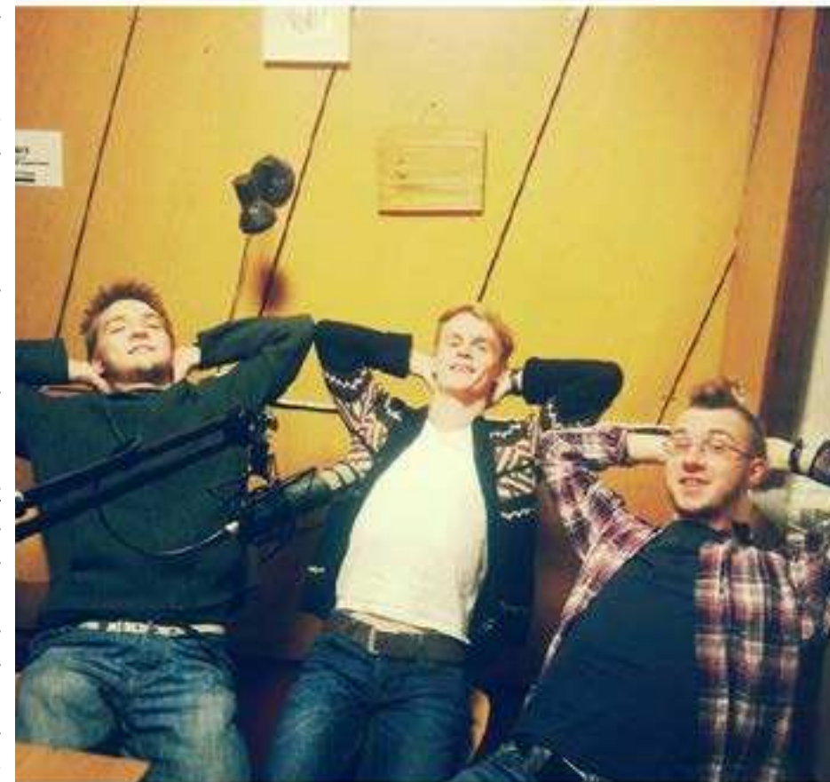
Ansambel POSÕ Generaadio otse-eetris oktoober 2014

Samuti said suvel tehtud olulised uuendused tehnilise poole peal. Generaadio koduleht kolis omanimelisele domeenile, samuti said tegijad @generaadio.ee-nimelised meiliaadres-