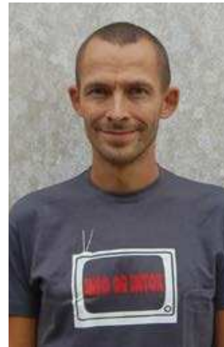
Generaadio peatoimetaja oktoober 2014 - tänaseni

2014. aastat võib Generaadio puhul igati edukaks lugeda. Alguse sai nii raadiojaam ise kui ka seda haldav-koordineeriv MTÜ. Puhtast entusiasmist ning oma vabast ajast vabatahtlike poolt tehtava raadio esimeseks suureks plussiks võib pidada asjaolu, et hoolimata suurest nõo kaadrivoolavusest on raadio tegemine olnud piisavalt väljakutsuv, et lahkuvate saatejuhtide ning saadete asemele tuleksid tasapisi uued huvilised. See aga eeldab pidevat raadio tutvustamist ja sellest rääkimist pea kõigile, kellega kokku puutume. Finantside poolelt vaadates võib tunda heameelt selle üle, et Tartu linn on otsustanud jätkuvalt panna Generaadiotele öla alla vastava rahalise toetuse näol ka 2015 aastal.