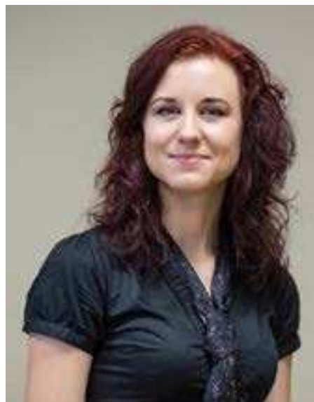
Generaadio peatoimetaja Jaanuar 2014 - oktoober 2014